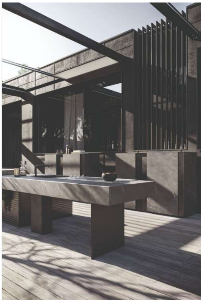
La nouvelle cuisine outdoor Project 05 de Modulnova Modulnova

En résumé, la Cuisine Outdoor Project 05 de Modulnova incarne l'essence même de l'art culinaire en plein air. En alliant design raffiné, fonctionnalité optimale et intégration harmonieuse avec l'environnement, elle redéfinit les standards de la cuisine extérieure. Avec cette collection, Modulnova nous invite à repenser notre manière de vivre et de cuisiner en plein air, pour une expérience sensorielle inoubliable.