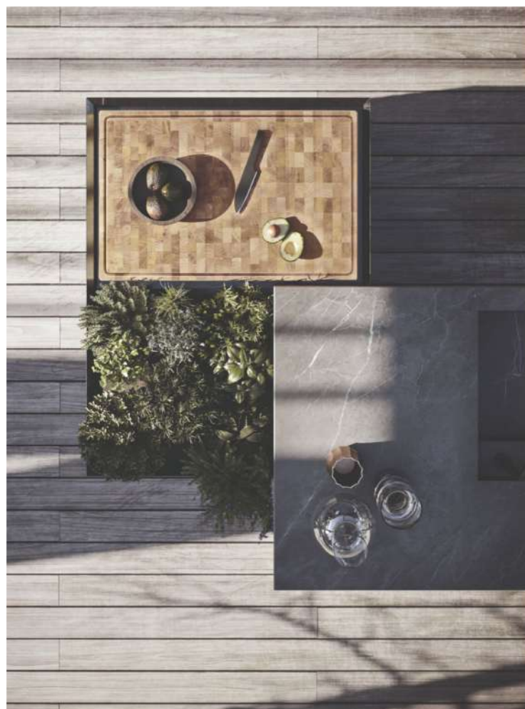
Un plan de travail Mediterraneo en pierre Graphite Raw, une planche à découper en bois naturel et un cadre naturel luxuriant. Une fusion parfaite entre design contemporain et environnement naturellement magnifique. Modulnova