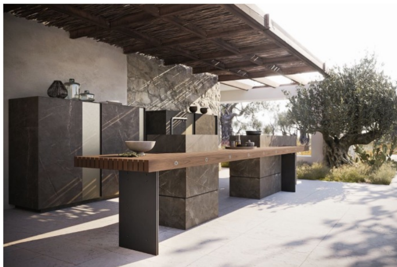
Il bancone XY con i blocchi cottura e lavaggio

Nel Project 1, risaltano gli speciali i blocchi cottura e lavaggio del sistema Block a tre doghe in gres Gold Brown, le cui superfici rimandano alla pietra naturale. Il sistema Block definisce blocco lavabo dotato di vasca per il lavaggio e miscelatore abbattibile. Il blocco cottura è completato dal piano cottura Mate in appoggio , indicato per le soluzioni outdoor perché resistente agli agenti atmosferici, all'umidità e alla salsedine. Anche questa dotazione tecnica è customizzabile: i piani cottura freestanding Mate, elettrici o a gas, in acciaio AISI 316, infatti, sono facilmente amovibili, intercambiabili e posizionabili con la massima libertà . Inoltre, è possibile completare il piano cottura con l'equipaggiamento più adatto a soddisfare le proprie aspirazioni o esigenze tecniche, inserendo per esempio piastre a induzione , piastre teppanyaki o una griglia per il barbecue.