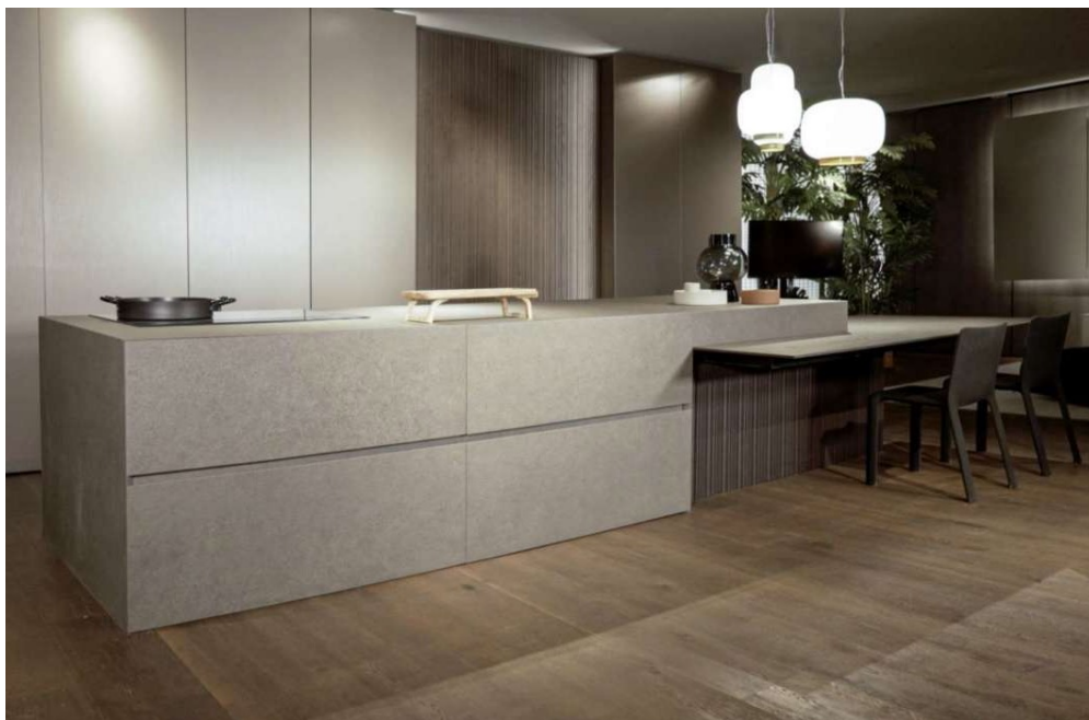
Modulnova: la nuova Fly Gres/Blade