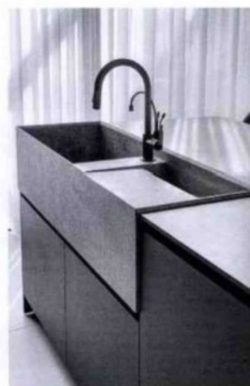
Il lavabo integrato in pietra è stato realizzato in Italia.

L'angolo pranzo, anch'esso parallelo alla cucina, è invece delimitato da un grande tavolo in legno chiaro che crea un'atmosfera di accogliente convivialità. La disposizione parallela dei mobili della cucina, dell'isola attrezzata e dell'angolo pranzo consente di godere della vista sul cortile centrale, impreziosito da una piscina Jacuzzi rivestita in piastrelle verdi, e di una visuale sul corbile interno che si sviluppa lungo entrambi i lati dello spazio centrale.