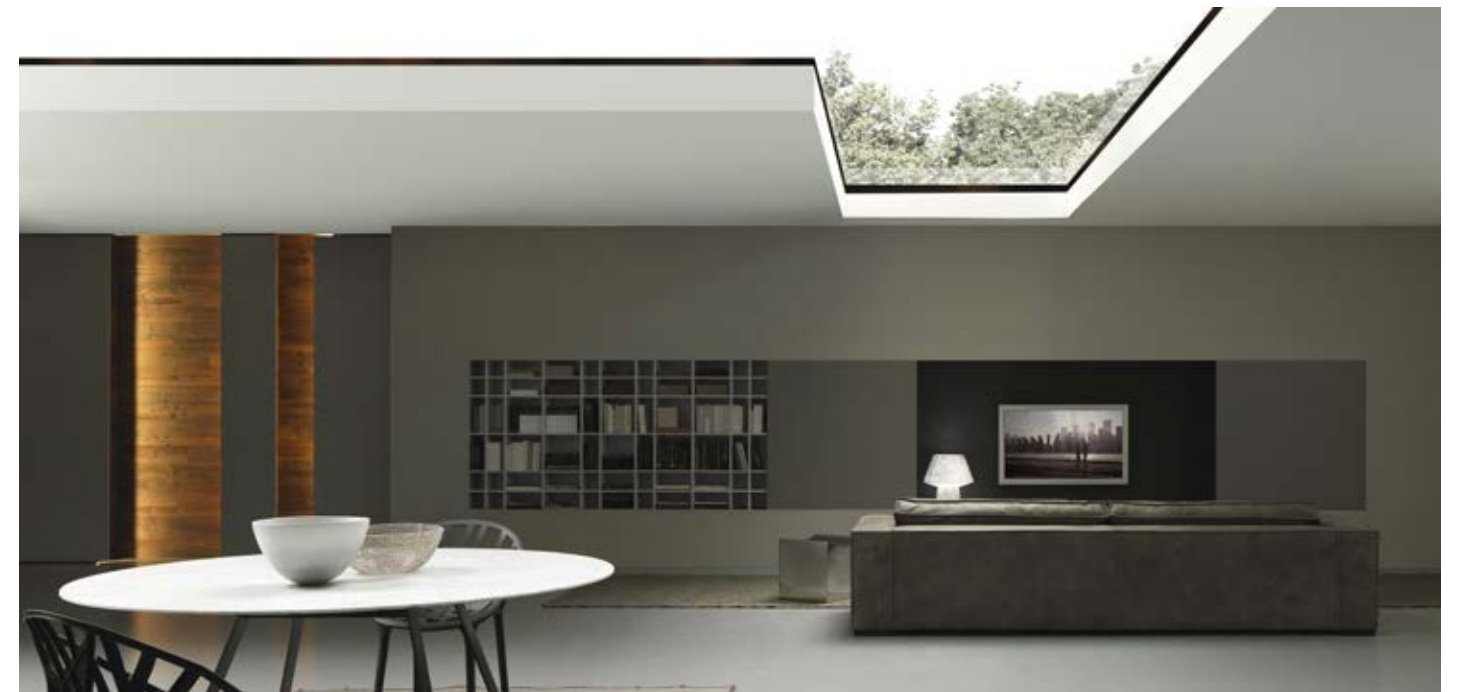
Sopra: la cucina Blade in Marmo Sahara Noir, novità Eurocucina 2018. In basso: una proposta living, completa di tavolo e libreria, dal programma Blade per MD-Home, il brand di Modulnova dedicato alla zona giorno. La trasversalità e flessibilità di Blade ne consente infatti la declinazione non solo come cucina, ma anche come progetto bagno e living.