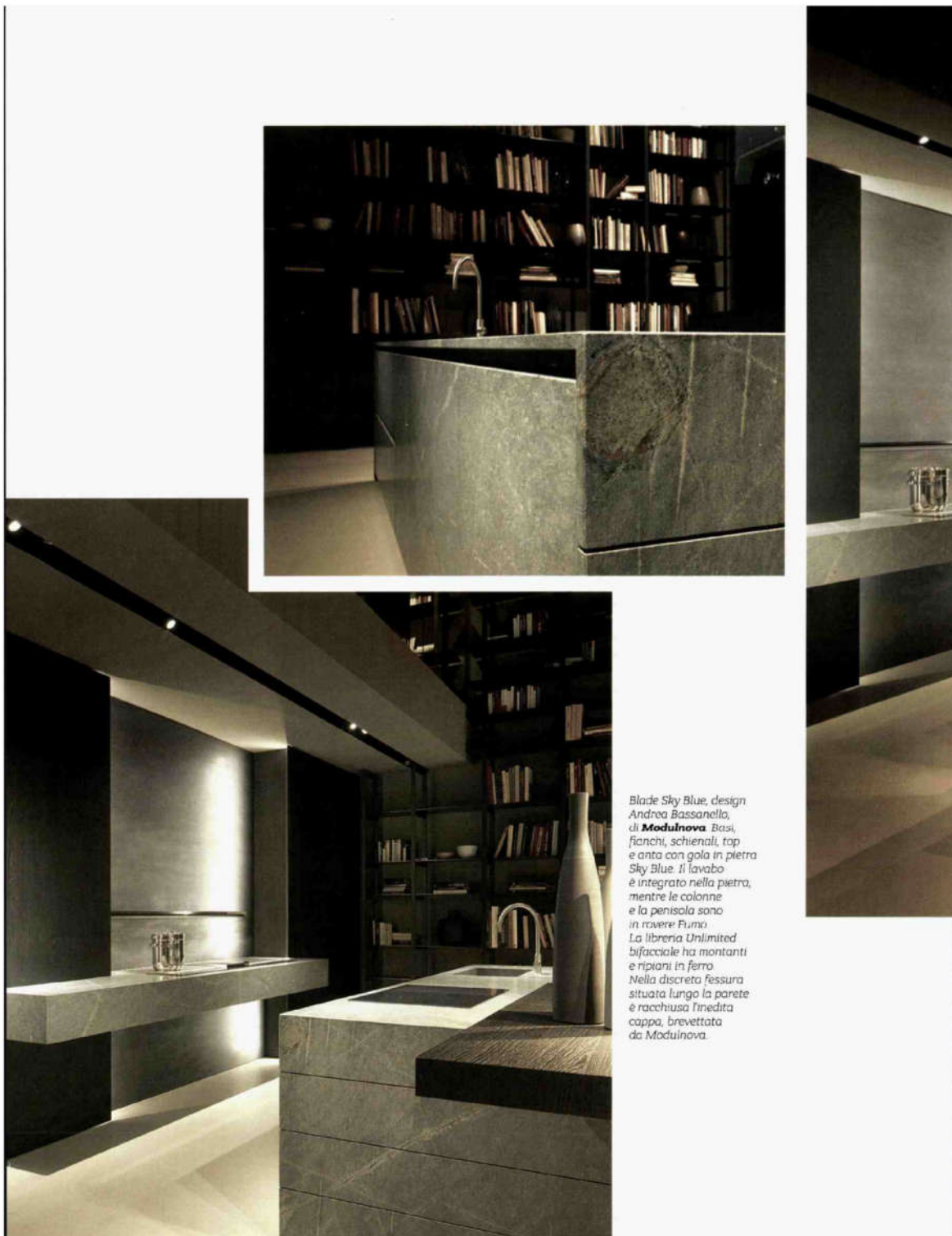
Blade Sky Blue, design Andrea Bassanello, di Modulnova . Basi, fianchi, schienali, top e anta con gola in pietra Sky Blue. Il lavabo è integrato nella pietra, mentre le colonne e la penisola sono in rovere Fumo. La libreria Unlimited bifacciale ha montanti e ripiani in ferro. Nella discreta fessura situata lungo la parete è racchiusa l'inedita cappa, brevettata da Modulnova.